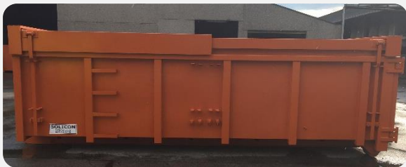
Conteneur avec toit ouvrant