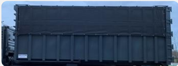
Conteneur avec filet à papillons