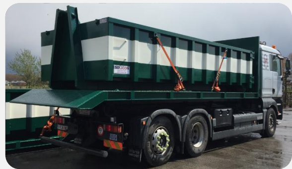
Conteneur à déchets chargé sur plateau ( plateau chanfreiné à l'arrière )

Venez découvrir notre gamme complète sur les sites suivants :